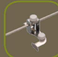
Elastiekgeleider Instelbare naadgeleider