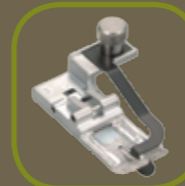
Transparante naaivoet Naaivoet met middengeleider